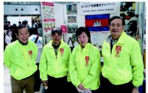
大阪ワンワールドフェスタ(大阪事務局)