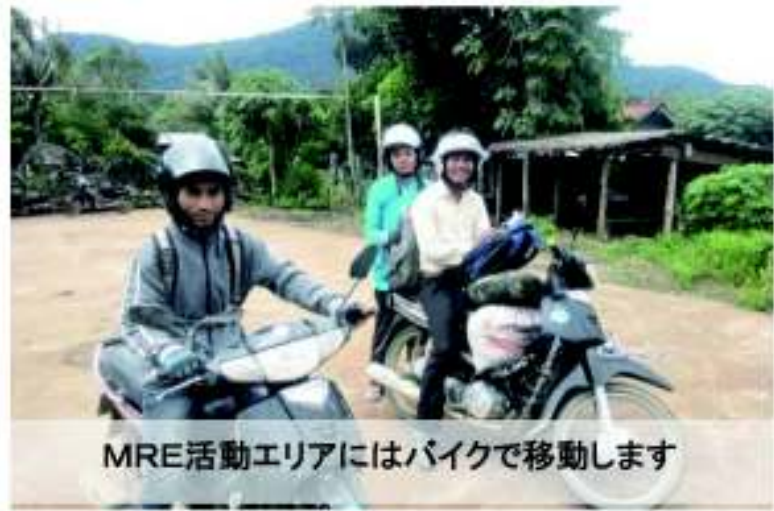
MRE活動エリアにはバイクで移動します