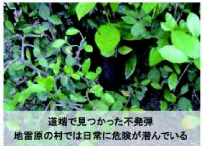
道端で見つかった不発弾 地雷原の村では日常に危険が潜んでいる