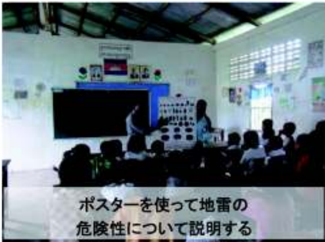
ポスターを使って地雷の 危険性について説明する