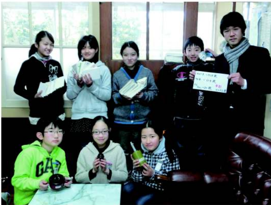
福岡市立愛宕小学校

2011年にスタートした書き損じはがき回収プログラムも今年で3年目を迎え、身近にあるものでできる国際協力として多くの方にご支持頂いております。今年度はテレビや新聞などメディアなどで紹介して頂く機会が多かった為、個人様の協力者が昨年に比べ、約3倍近く増加しました。