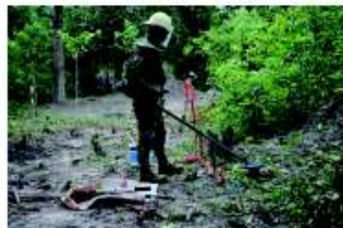
CSHDの地雷撤去現場を視察