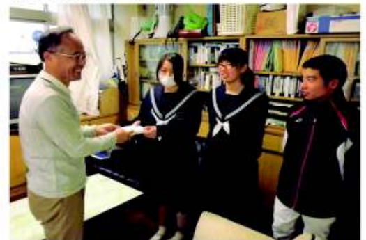
鳥栖市立田代中学校