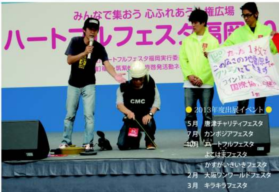
ハートフルフェスタ福岡2014

今年度もイベント出展や募金活動、チャリティ事業を通し、地雷問題の啓発活動を行いました。イベントでは、毎回多くのボランティアの皆様にご協力頂き、特に東京、大阪などはボランティアスタッフが中心となり準備から当日の運営まで行っていました。皆様のご協力に心より感謝申し上げます。