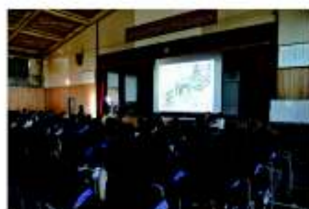
白河市立白河第二中学校にて東北事務局十文字ご夫妻講演