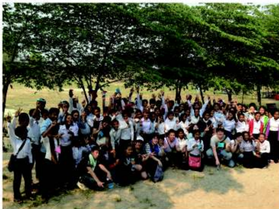
CMCトゥールポンローみおつくし中学校での交流

今年度より学生向けのツアー「NGO駐在員と行く!カンボジアツアー」を夏休みの8月・9月と春休みの3月に実施しました。その他、毎年行っているツアーと合わせて、ツアー本数は過去最多を記録し、ツアー参加者は、87名に達しました。参加者からは、「NGOの現地での活動を知ることができた」「カンボジアの現状を自分の周りにいる人から伝えていきたい」などのお声を頂きました。