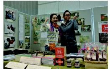
きらきらフェスタ(東北事務局)