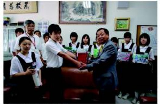
福岡市立高宮中学校