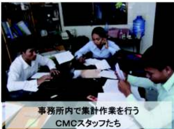
事務所内で集計作業を行う CMCスタッフたち