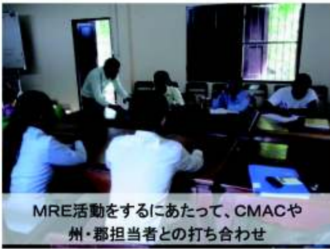
MRE活動をするにあたって、CMACや 州・郡担当者との打ち合わせ