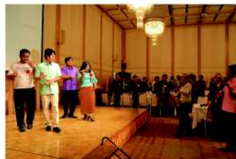
カンボジア留学生のダンス