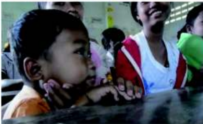
お姉ちゃんに連れられてきた 未就学の弟も熱心に聞いてます