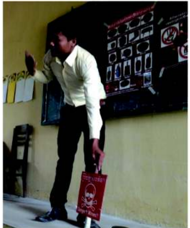
ドクロマークの赤い看板や地雷模型を使って 子供たちに地雷原での注意を促す