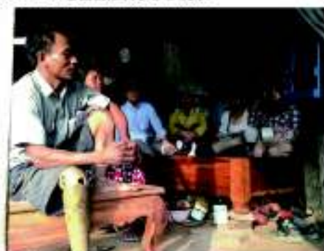
地雷被害者へのインタビュー