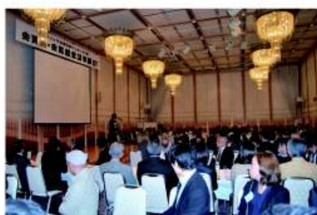
福岡ガーデンパレスにて行われた祝賀会