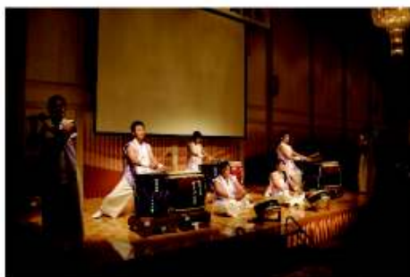
粕屋町和太鼓ガイヤの響様