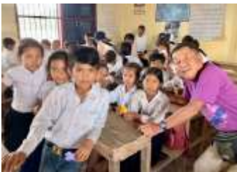
CMCポップイ三好小学校 (2017/11月落成)