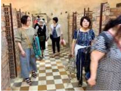
2月12日 プノンペン トゥールスレン虐殺博物館 (S21) 収容所

プノンペンタワー、トゥールスレン収容所、CSHD地雷原、CMAC地雷原、支援先の学校4校、フィジカルリハビリセンター、Little Angel、地雷博物館、アンコールワット遺跡群他 (ツアー詳細はCMCのHP、フェイスブックページにて)