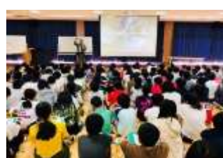
筑紫野市立二日市東小学校