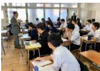
福岡県立修猷館高校