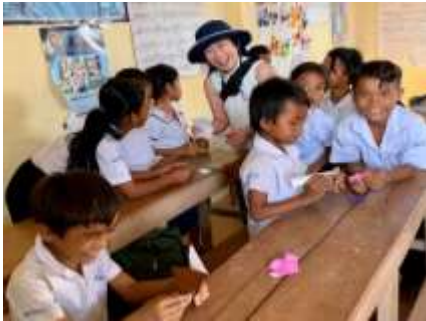
2月13日 CMCポップイ三好小学校