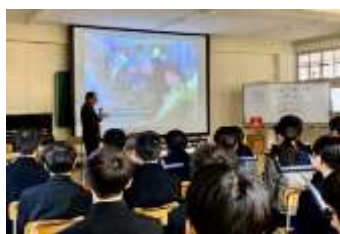
飯塚市立二瀬中学校