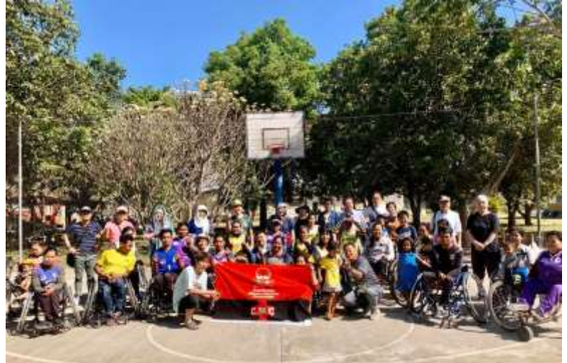
2月15日 国際赤十字 (ICRC) の事業を引き継ぐ、バットンバンPRC (フィジカルリハビリセンター) を訪問。 地雷被害者に無償で義手・義足を提供し、リハビリや車椅子バスケットなどのスポーツも行っている。