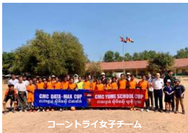
コントライ女子チーム