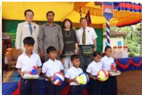
子どもたちにボールと学用品贈呈