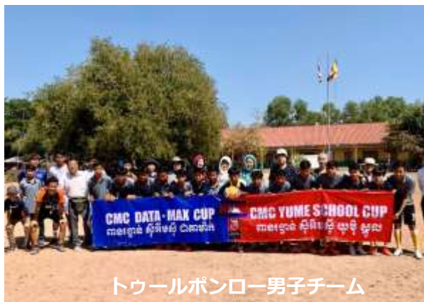
トゥールポンロー男子チーム