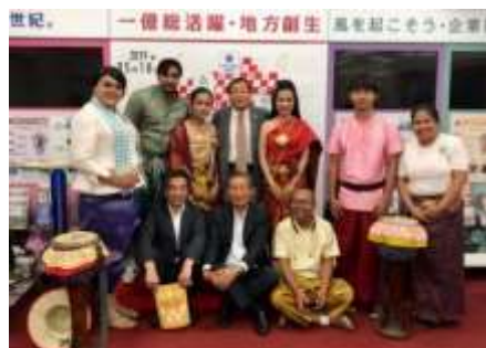
西日本カンボジア友好協会事務局にて