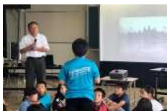
粕屋町立粕屋西小学校