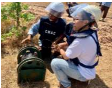
2月14日 CMAC地雷原で爆破作業