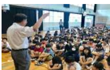
福岡市立西新小学校