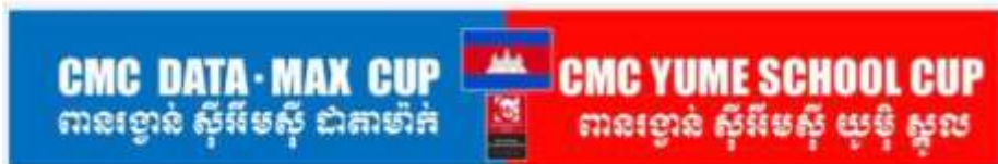
CMCが建設した中学校同士のサッカー交流試合の横断幕