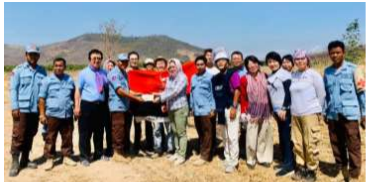
2月14日 バットンバン州サムロット郡 CMAC地雷原を視察後 ドネーション