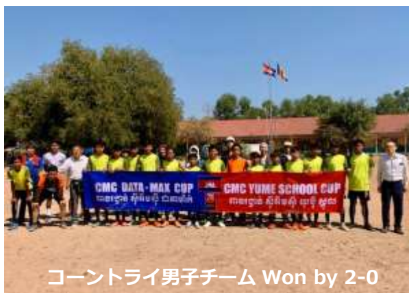
コントライ男子チーム Won by 2-0