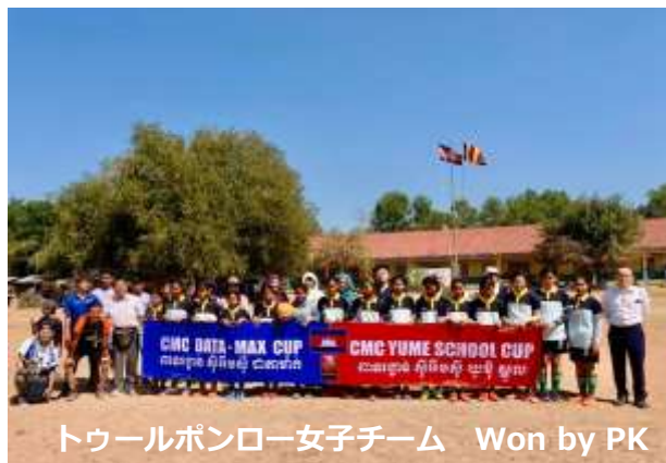
トゥールポンロー女子チーム Won by PK

夢スクール2008様、株式会社データマックス様及びカンボジア プロサッカーチームのアンコールタイガーFC様、カンボジアスポーツ用品NTスポーツ様の支援・協力によりコントライ中学校グラウンドにて開催されました。コントライ中学、トゥールポンロー中学の対抗戦で男子は「CMCデータマックス杯」、女子は「CMC夢スクール杯」として行われました。それぞれのウィナーカップは次回に引き継がれますので第2回イベントを楽しみにしたいと思います。（イベント詳細はCMCのHP、フェイスブックページにて）