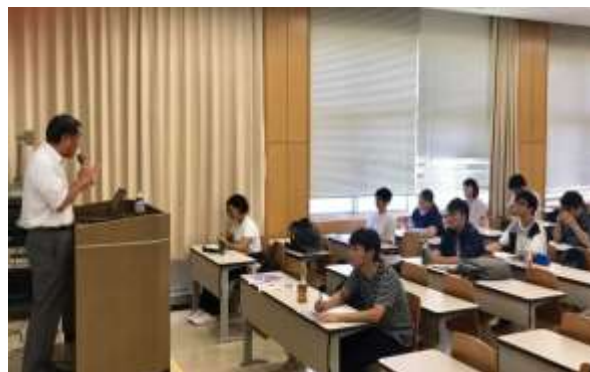
福岡教育大学での講義

また、日本各地にボランティアで関わっているCMCメンバーがおりますので、全国各地で講演を行っています。