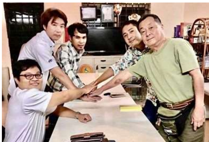
現地法人の早期設立を目指して団結！