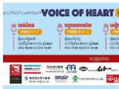
ラジオ番組のポスター