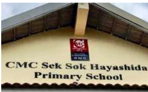
6月に落成したCMCセクソク林田小学校の側面