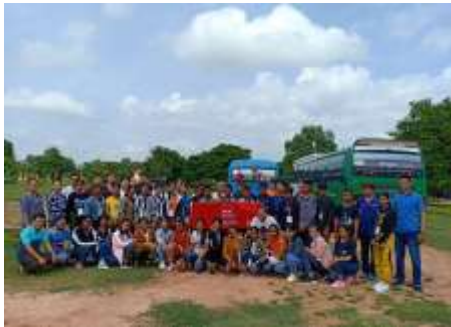
2019年10月14日 修学旅行出発前