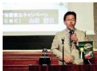
名古屋東山ロータリークラブ