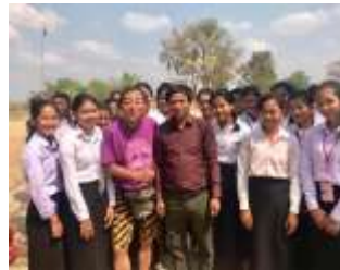
CMCトゥールポンロー みおつくし中学校 (2010/12月落成)