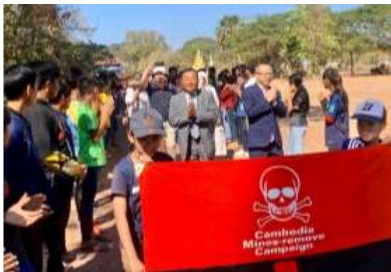
2月16日 CMCコントライ夢中学校