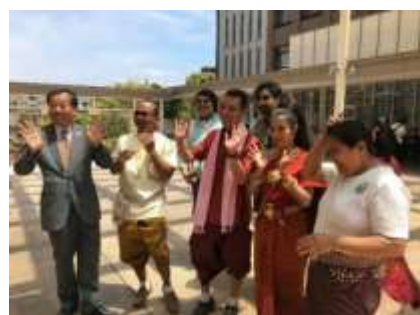
中村学園大学にて