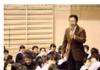
名古屋市立若水中学校