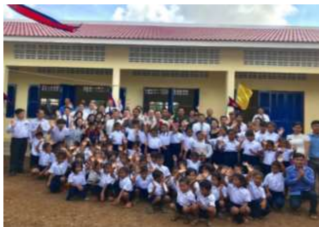
全校生徒の喜びの顔