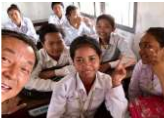
CMCコーントライ 夢中学校 (2008/9月落成)