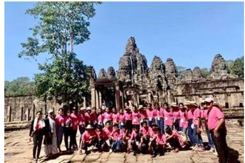
10月15日アンコールワット（修学旅行）