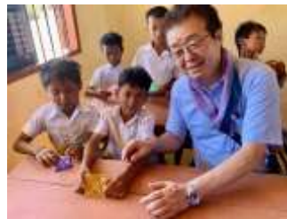
CMCセクソク林田小学校 (2019/6月落成)